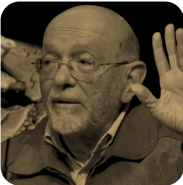
Eduardo Matos Moctezuma Premio Princesa de Asturias de Ciencias Sociales 2022 2022