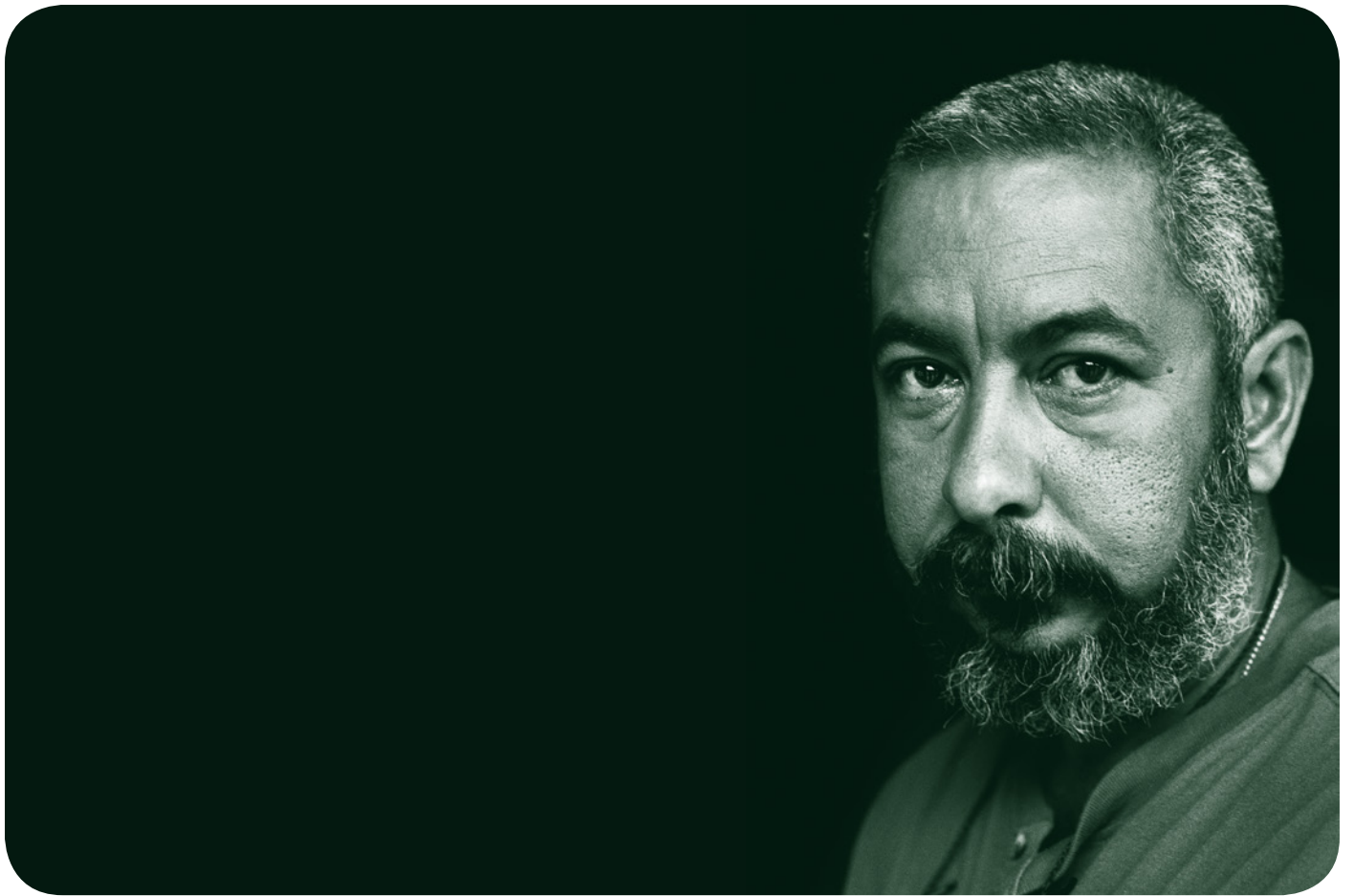
Leonardo Padura Premio Princesa de Asturias de las Letras 2015