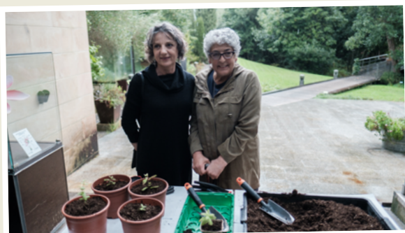
Visita al Jardín Botánico Atlántico de Gijón.