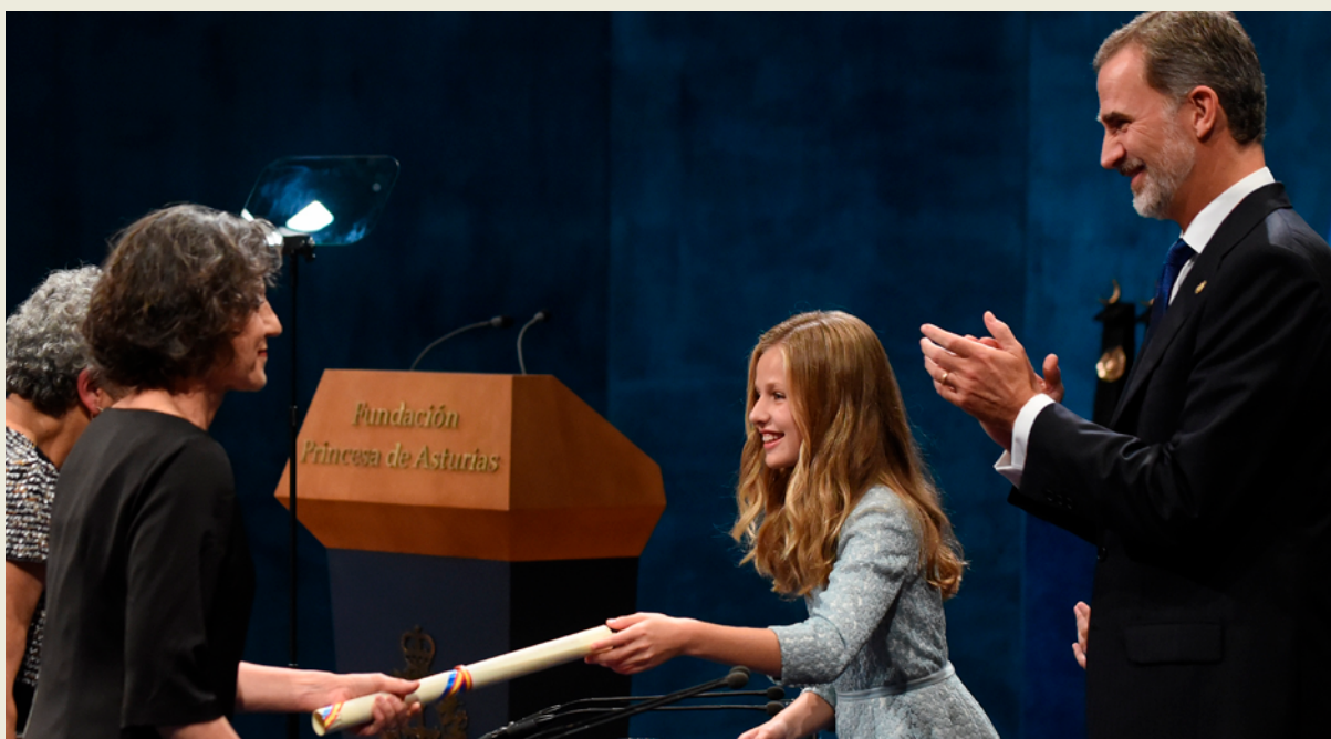
Sandra Myrna Díaz, junto a Joanne Chory, en la ceremonia de entrega de los Premios Princesa de Asturias 2019 en el Teatro Campoamor (Oviedo).

El mensaje de Díaz nos inspira a seguir conociendo y protegiendo la naturaleza. Hacerlo es cuidar de todos nosotros, porque nosotros somos naturaleza.