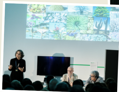
Encuentro con el público.