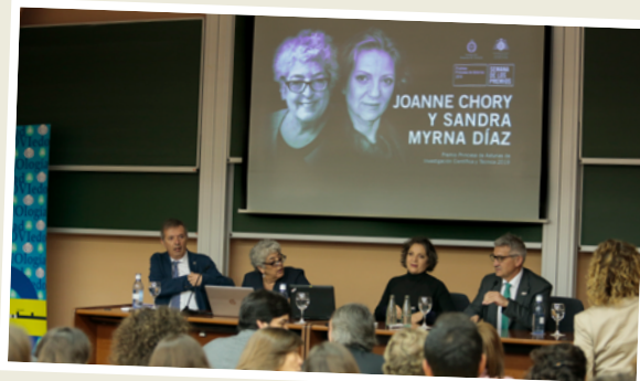
Conferencia en la Facultad de Biología de la Universidad de Oviedo.