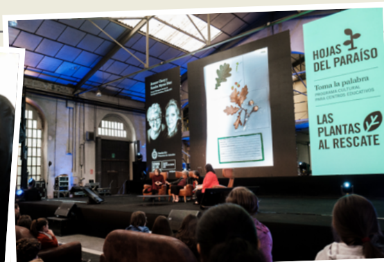
Encuentro con estudiantes y docentes.