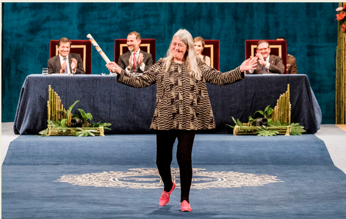
Mary Beard en la ceremonia de entrega de los Premios Princesa de Asturias 2016 en el Teatro Campoamor (Oviedo).

En 2024, gracias a la extraordinaria capacidad de Mary Beard para trasladar al gran público sus conocimientos académicos, «La aventura de los clásicos... continúa».