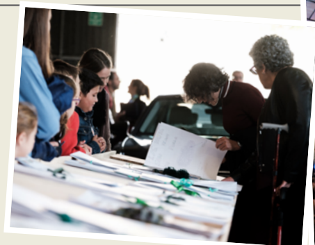
Exposición de herbarios «Hojas del paraíso».