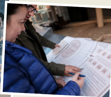
Imágenes de la Yincana Romana «La clásica pista» (Gijón).