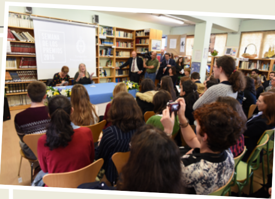
Mary Beard durante el acto en el IES Pérez de Ayala (Oviedo).