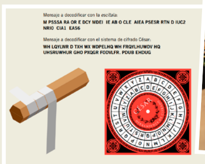
Escítala y cifrado César.