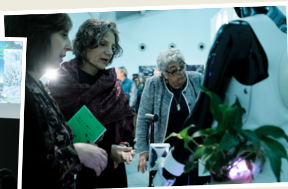
Visita a la exposición «Eco-Visionarios».